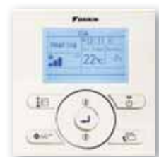
BRC073 en option.